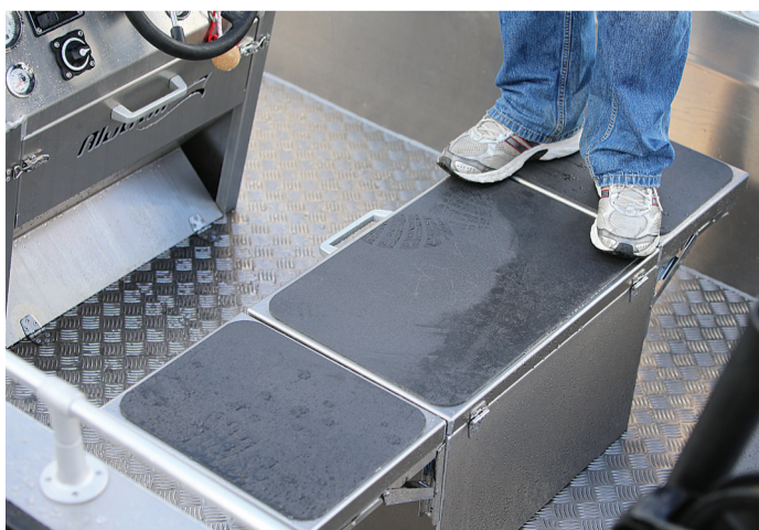
Klaffipenkit pulpetin takana ovat isonkin kalastajan kestävät.