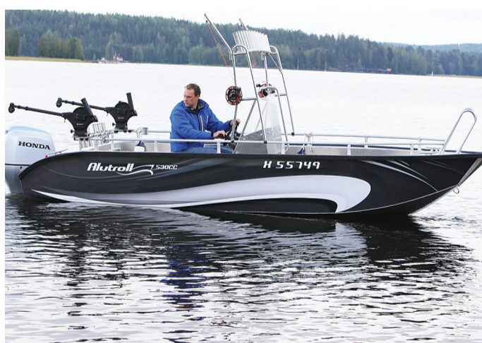
Leveydeltään 2-metrinen vene ei paljon kallistele kalastajien siirtyessä paikasta toiseen. Vene on rekisteröity kuudelle.