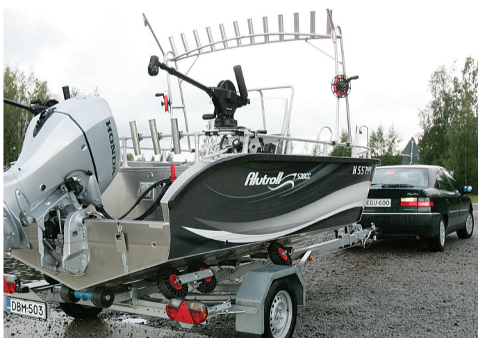
Alutroll 530CC kulkee tavallisen henkilöauton vetämässä 1200 kg:n jarrullisella trailerilla, mikä on tärkeä syy asiakkaiden esittämiin toiveisiin.